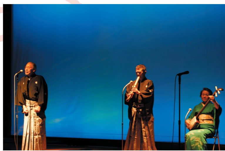
江差追分実演 江戸時代、北前船の船頭たちによって江差に伝えられたとされる追分節に江差独特のアレンジが加わり誕生した江差追分の実演をご覧ください。