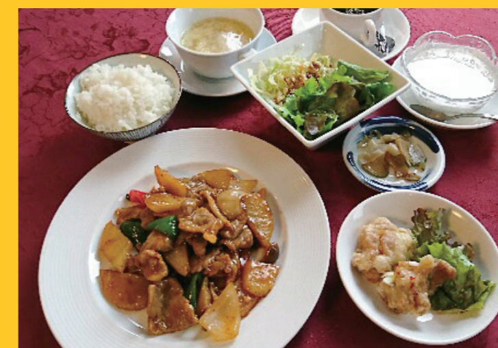
彩風塘(夕食) 厚沢部町特産メークインと豚肉のピリ辛炒め、厚沢部町産ふっくりんこの米粉を使った唐揚げなど地元食材を使用した中華をご用意します。