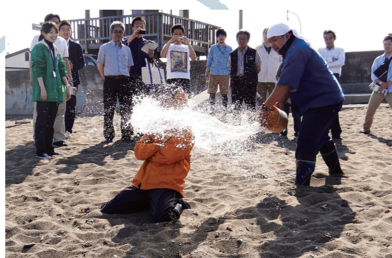
木古内みそぎまち歩き(寒中みそぎ体験) 希望者はみそぎ浜で木古内町に伝わる伝統神事「寒中みそぎ体験」ができます。