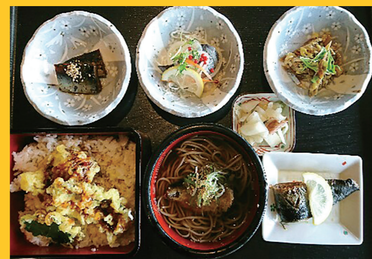
お食事処えさし(昼食) 江差の文化・街並みが、文化庁の日本遺産に認定されたことを記念して作られた新メニュー「網元にしん御膳」をご用意。ニシン漁で栄えた江差の魅力が伝わる一品です。