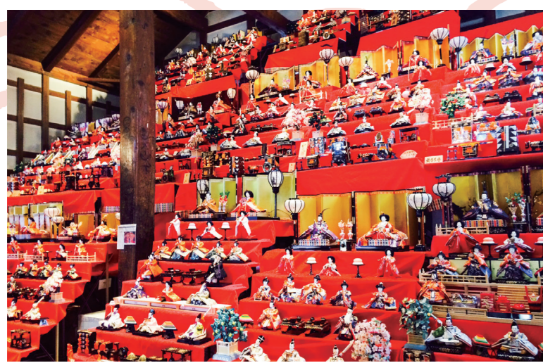
いにしえ街道散策 地元ガイド付きでいにしえ街道を散策します。江差・北前ひな祭り期間中のため、店先にはお雛様が展示されており、冬景色の中、色彩溢れる暖かなひな人形達が街を彩っています。