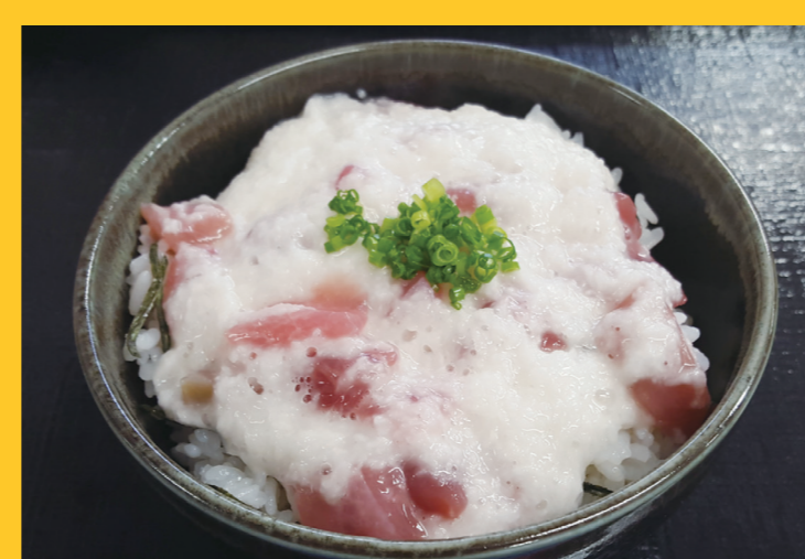
道の駅北前船松前(昼食) 津軽海峡本マグロの生産地である松前。津軽海峡の絶景を望むことができる道の駅 北前船松前で、マグロ山かけ丼をお召し上がりいただけます。