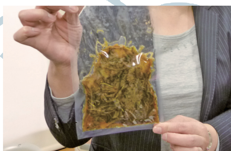
松前漬作り体験 スルメや昆布を漬け込んだ松前町の郷土料理松前漬。地元の味を手作り体験し、お土産に持ち帰っていただけます。